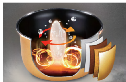
หม้อชั้นในเคลือบ 5 ชั้น ความร้อนสม่ำเสมอ ทำความสะอาดง่าย