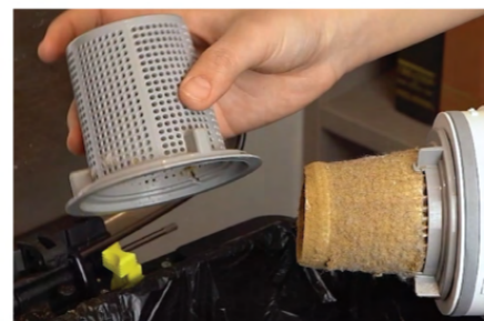
ฟากรอบที่กรอง ถอดล้างทำความสะอาดได้