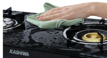
ไม่เป็นสนิม ทำความสะอาดง่าย