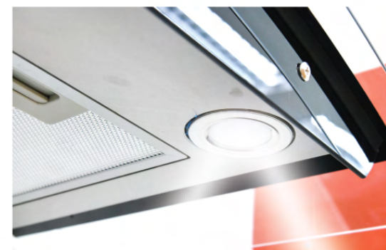
ดวงไฟขนาดใหญ่ ไฟส่องสว่างระหว่างการใช้งาน