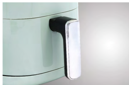
ด้ามจับ จับถนัดมือ ป้องกันความร้อน