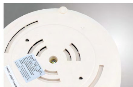
ช่องระบายความร้อน กระจายความร้อนด้านล่าง ขณะทำงาน