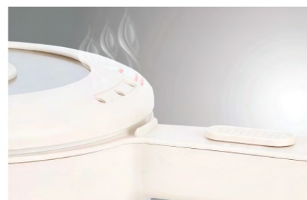
รูระบายไอน้ำ ช่วยระบายไอน้ำ ลดแรงดันภายในหม้อ