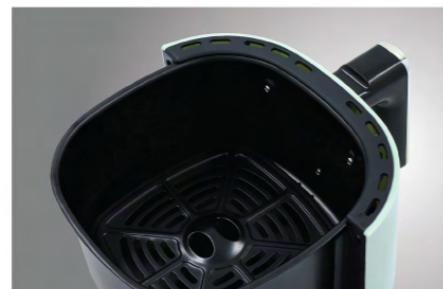
หม้อด้านในเคลือบ Non-Stick ล้างทำความสะอาดได้ง่าย