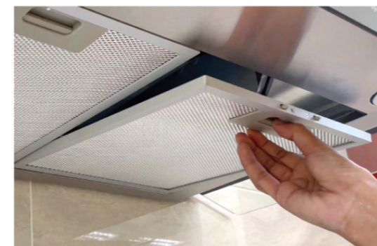
ตะแกรงถอดได้ ตะแกรงถอดล้าง ทำความสะอาดได้ง่ายแค่กดนิ้ว