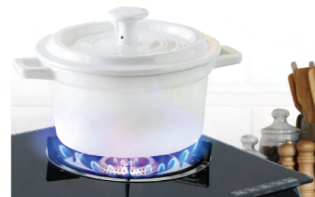
เตาแก๊สหัวฟู ให้เปลวไฟแรง ให้ความร้อนรวดเร็ว