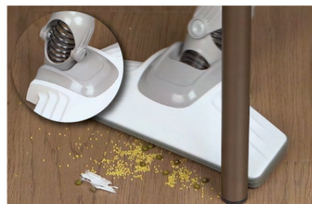
หัวแปรงดูดพื้น ปรับโค้งตามมุมพื้นห้องได้ ใช้งานง่าย