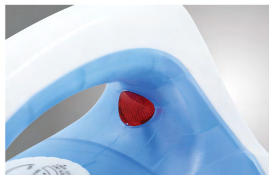
ไฟแสดงสถานะการทำงาน ไฟแสดงสถานะชัดเจน