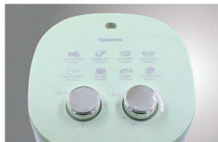
ลูกบิดใช้งานง่าย ลูกบิดหมุนง่าย มีเสียงแจ้งเตือนเมื่อเสร็จ