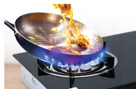
เตาแก๊สหัวเทอร์โบ ให้ความร้อนเร็ว ประหยัดเวลาปรุงอาหาร