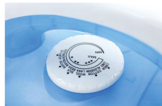
ปุ่มปรับระดับความร้อน ปุ่มขนาดใหญ่ หมุนง่าย มีให้เลือกหลายระดับ