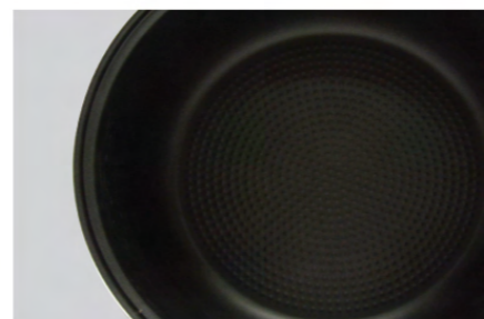
หม้อในเคลือบ Non Stick ทำความสะอาดง่าย