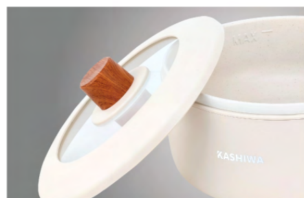
ฝาแก้ว มีที่จับ ฝาปิดใส่สามารถมองเห็นภายในได้