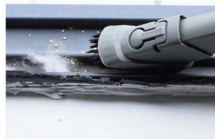
หัวแปรงดูดซอก แรงดูดสูง เข้าถึงฝุ่นในพื้นที่ยาก